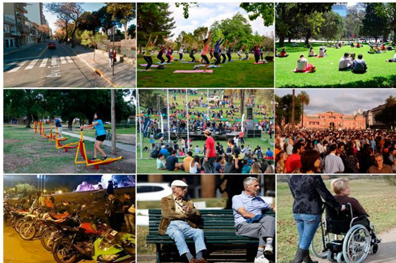
Múltiples usos y desempeños en un espacio social

2-LECTURA PARA PROFUNDIZAR SOBRE EDUCACION VIAL Y ESPACIO PUBLICO.